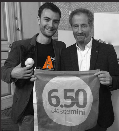
Rencontre à Niort avec Michel Desjoyeaux